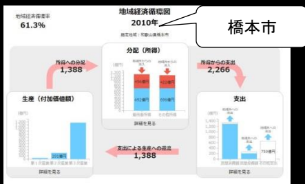
地域経済循環をお金の流れで表示

みなさんがこれから活躍する社会。そこは、データの分析なしではやっていけない世界です。 モノやサービスひとつ売るのにも、誰が何を求めているか、データの分析が必要です。 RESASを使うことで、その一端にふれてみませんか？